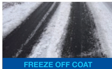
FREEZE OFF COAT

POINT 겨울철에도 차들이 안전하게 주행할 수 있는 상태를 만들어줍니다.